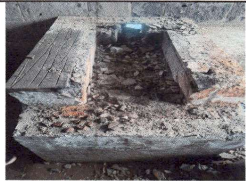
Fotografía 14 SUSTITUCIÓN DE ESTUFA RURAL