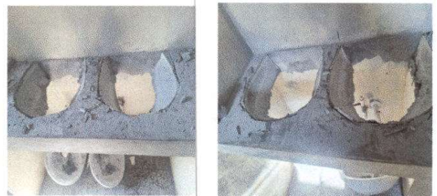
Fotografía 6: SUSTITUCION DE LAVAMANOS

Observación: Si es necesario se pueden agregar hojas adicionales y actualizar el número de hojas.