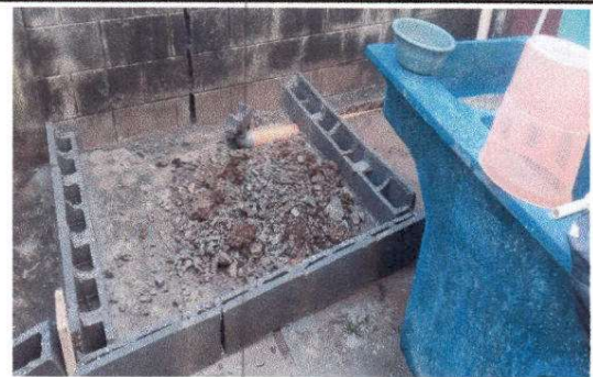
Fotografía 16 SUSTITUCIÓN DE PILA DE CEMENTO DE DOS LAVADEROS

Observación: Si es necesario se pueden agregar hojas adicionales y actualizar el número de hojas.