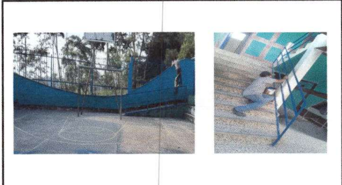
Fotografía 8 MANTENIMIENTO DE BARANDA DE METAL