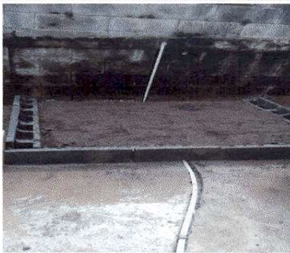
Fotografía 13 SUSTITUCIÓN DE PILA DE CEMENTO DE DOS LAVADEROS