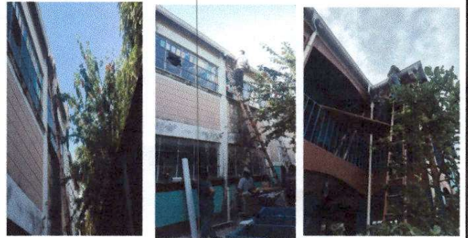
Fotografía 4 REPARACION DE BAJADA DE AGUA PLUVIAL TUVO PVC 3