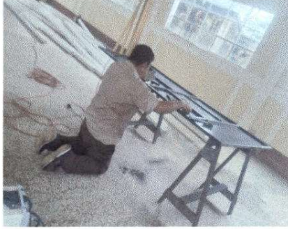
Fotografía 1 MANTENIMIENTO A ESTRUCTURA (LIJADO, CAMBIO DE TUBO, CEPILLADO, SUJECIONES, APLICACIÓN DE PINTURA)