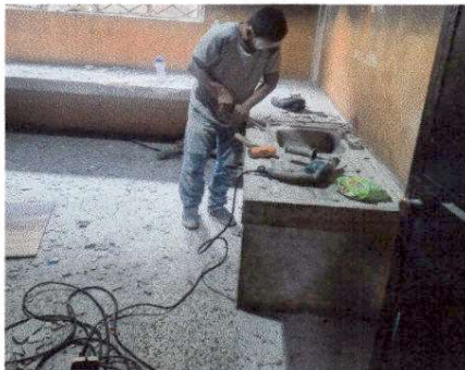
Fotografía 15 SUSTITUCIÓN DE LAVATRASOS (INCLUYE MEZCLARORA)