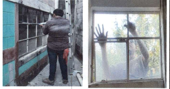
Fotografía 2 SUSTITUCION DE VIDRIOS