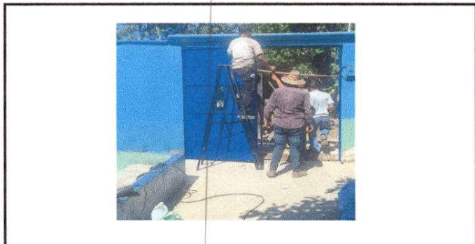
Fotografía FABRICACIÓN E INSTALACIÓN DE PORTÓN DE METAL DE INGRESO

Observación: Si es necesario se pueden agregar hojas adicionales y actualizar el número de hojas.