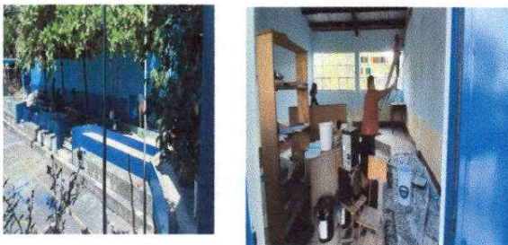
Fotografía 5: PINTURA DE MUROS EXTERIORES E INTERIORES