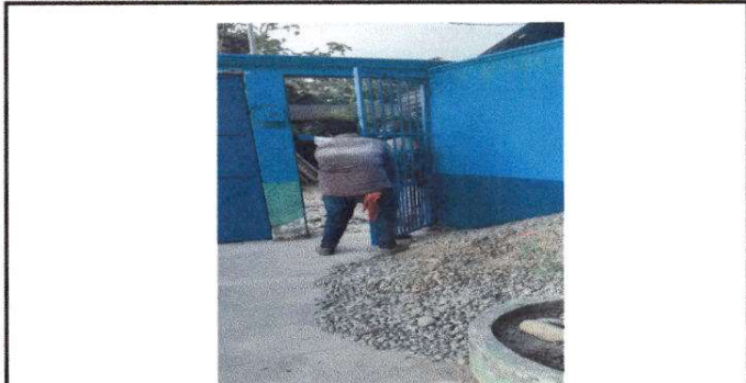
Fotografía 7 MANTENIMIENTO DE PORTON