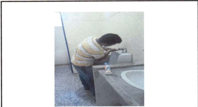
Fotografía 7 SUSTITUCION DE LLAVE DE MINGITORIO