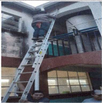
Fotografía 3 SUSTITUCION DE CANAL DE PVC