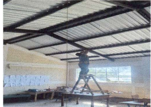
Fotografía 12 INSTALACIÓN DE UNIDADES DE LUZ (INCLUYE INTERRUPTOR, DUCTO Y CABLE ELÉCTRICO)