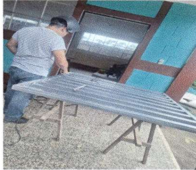
Fotografía 11 INSTALACIÓN DE ESTRUCTURA PORTANTE DE METAL